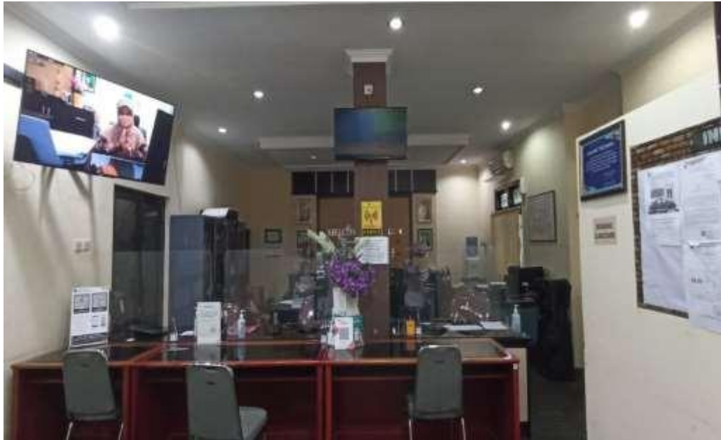
Gambar 1 : Ruang Pelayanan