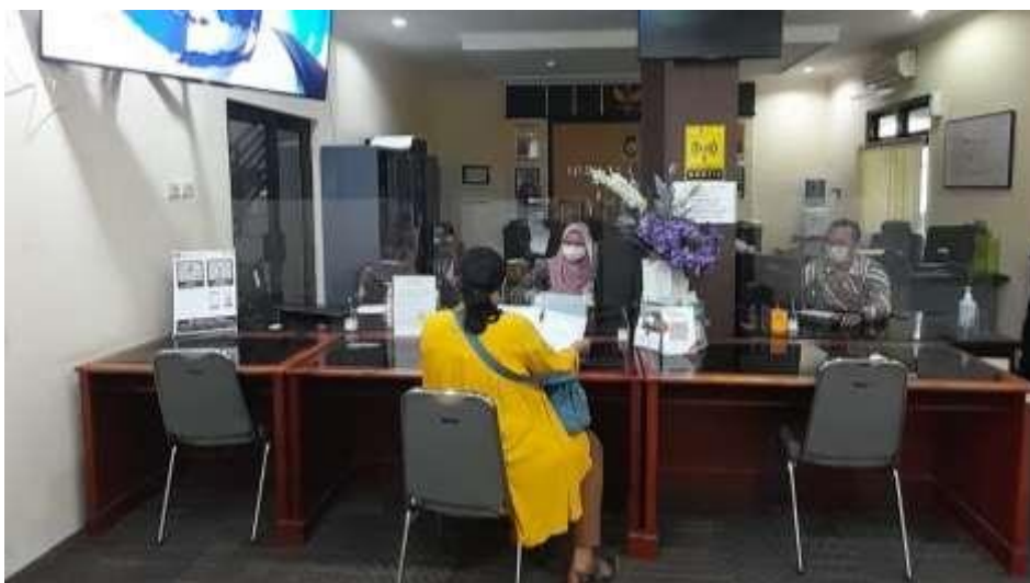
Gambar 3 : Layanan informasi